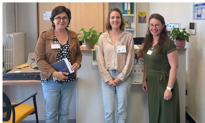
Équipe de la Maison Départementale de Proximité de Caraman et Lanta